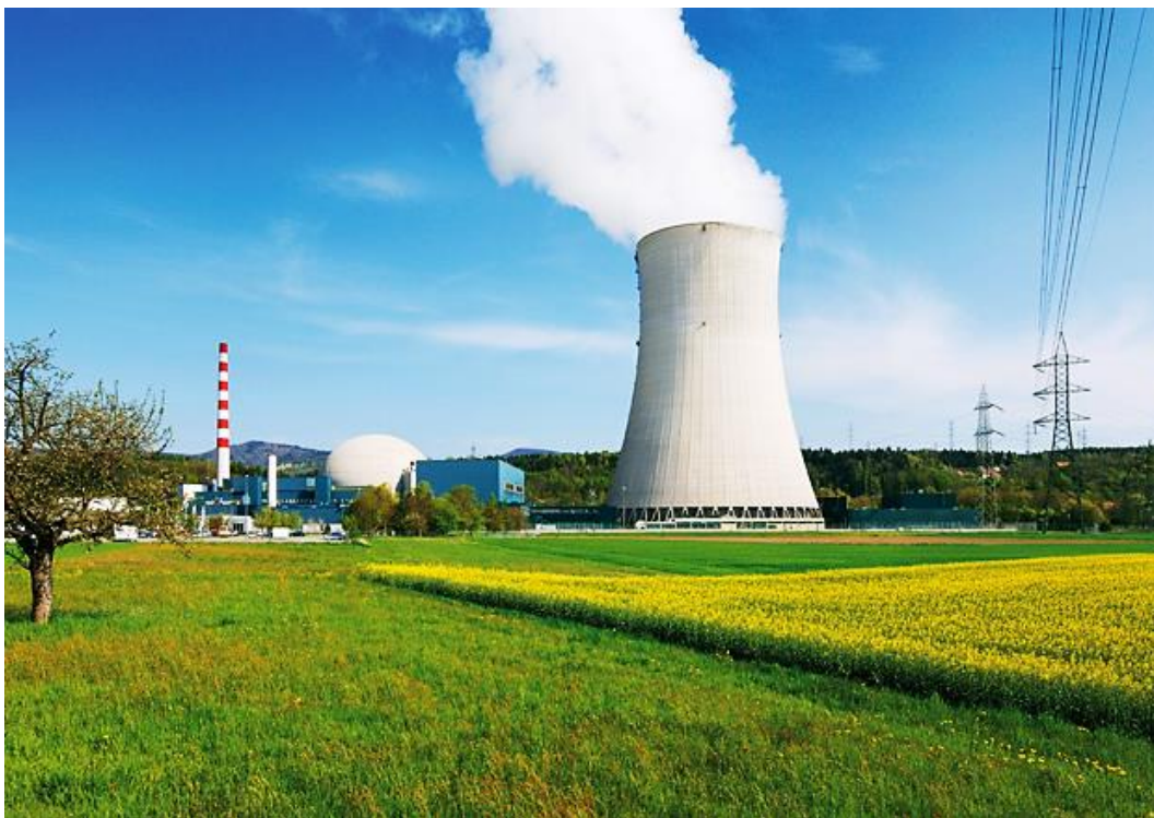
Kernkraftwerk Gösgen (Schweiz) 1

Selbst nach erfolgter oder noch bevorstehender Energiewende bieten sich für qualifizierte Fachleute viele Möglichkeiten, um in konventionellen Kraftwerken zu arbeiten. Ebenso werden für den Rückbau der Kernkraftwerke gut ausgebildete Spezialisten benötigt. In einigen europäischen Ländern werden zudem neue Kernkraftwerke gebaut.